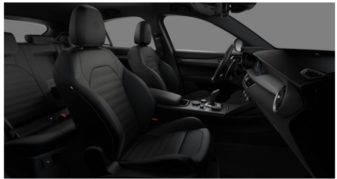
423 | Melnas apdares ādas sēdekļi