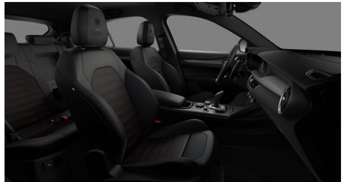
646 | Melnas ādas Tributo Italiano apdares sēdekļi ar sarkaniem akcentiem