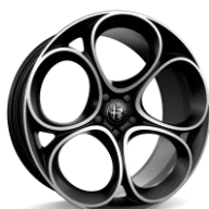
Speciale 8,5 x 20